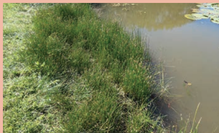
Végétation amphibie à Eléocharide