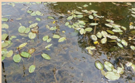
Herbier flottant à Potamot nageant