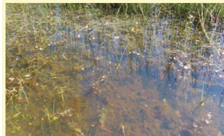
Voile aquatique à Utrriculaire