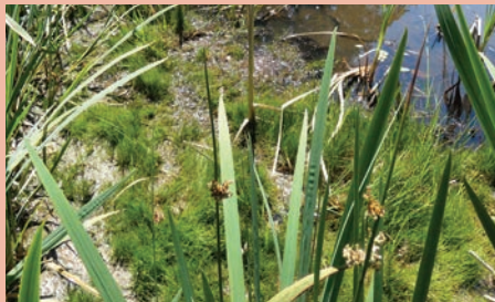
Gazon amphibie à Jonc bulbeux