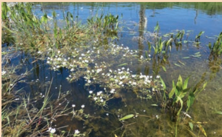
Herbier flottant à Renoncule peltée